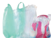
Suremballages, sacs, films en plastique