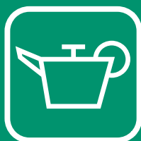
HUILES DE VIDANGE