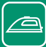
PETITS APPAREILS MÉNAGERS