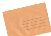
Les enveloppes kraft et le papier peint