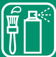
DÉCHETS DANGEREUX DES MÉNAGES