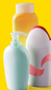
Les flacons de produits de toilette