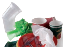
Gobelets et couverts plastique, assiettes carton, serviettes papier