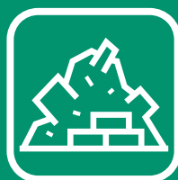
GRAVATS / INERTES