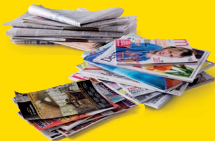
Les journaux, magazines, prospectus, enveloppes blanches et les papiers