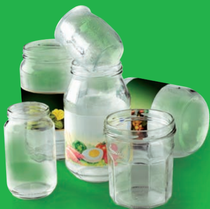
Les pots et les bocaux