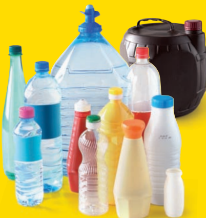
Les bouteilles d'eau, de soda, de lait, d'huile et condiments et les cubitainers