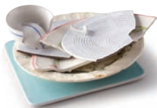
Vaisselle, faïence, porcelaine