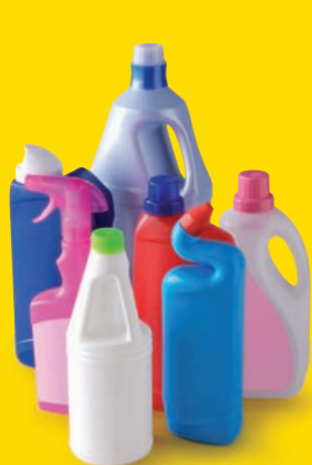
Les flacons de produits ménagers