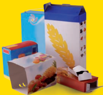
Les boîtes et suremballages en carton