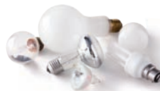
Ampoules électriques et à halogène