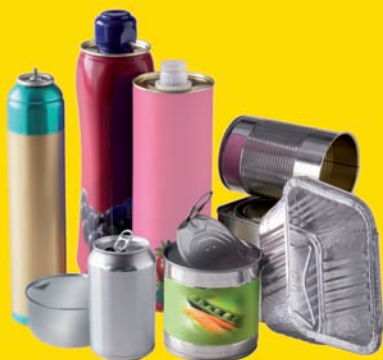
Les boîtes de conserve et les cannettes, les aérosols et les bidons