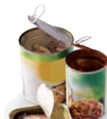
Boîtes contenant des restes