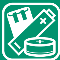
PILES ET ACCUMULATEURS