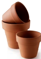
Pots de fleurs