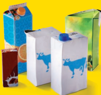
Les briques alimentaires