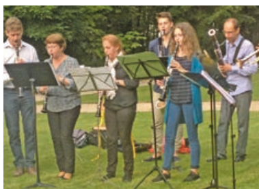
Les élèves adultes de l'École de musique répètent - P.13