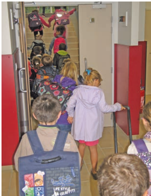
Rentrée 2015 (photo d'archives).

Le 1 er septembre, environ 1 360 élèves ont fait leur rentrée à Amilly, répartis dans les quatre groupes scolaires que compte la Ville. La modification du périmètre des secteurs de Viroy, du Clos-Vinot et des Goths est entrée en vigueur, conformément à une décision du conseil municipal, prise en commun accord avec l'inspectrice de l'Éducation nationale, de répartir plus équitablement les effectifs scolaires.