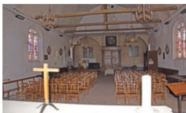
L'église de Saint-Firmin ouverte au public le dimanche 18 septembre - P.15