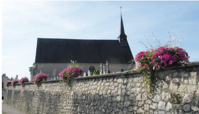
Église de Saint-Firmin, rue Francis-Prieur.

route en toute sécurité pour rejoindre les Tanneries. Après cet effort, un rafraîchissement les attendra à leur arrivée. Cet accueil convivial s'accompagnera d'une visite commentée à travers la Grande halle et le parc, pour découvrir l'histoire des Tanneries, de sa construction à l'inauguration du Centre d'art contemporain les 24 et 25 septembre. Le public apprendra comment le passé industriel du lieu a influencé le projet de réhabilitation de l'architecte et le projet artistique du Centre d'art.