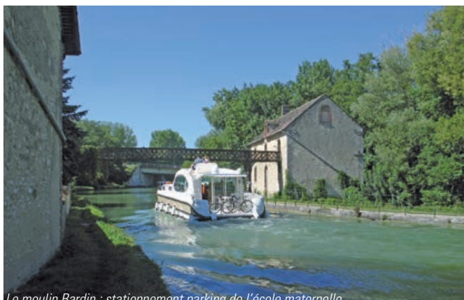
Le moulin Bardin : stationnement parking de l'école maternelle de Saint-Firmin, rue des Écoles, puis emprunter l'escalier.

Pour relier le Centre d'art contemporain – Les Tanneries, les visiteurs pourront enfourcher des rosalies. À bord de ce vélo-pédale à quatre roues, ils longeront le chemin de halage qui borde le canal de Briare. Ils pédaleront ainsi sur un petit kilomètre jusqu'à la rue des Ponts puis emprunteront la