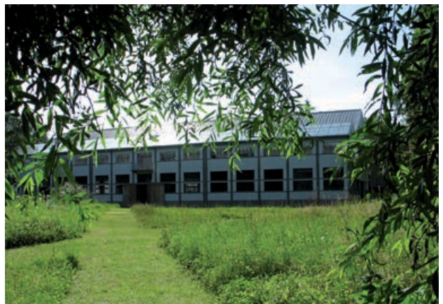
Les Tanneries - 234, rue des Ponts.

Journée du patrimoine Église Saint-Firmin - Moulin Bardin : de 9 h 00 à 12 h 00 et de 14 h 00 à 18 h 00 Centre d'art contemporain - Les Tanneries : de 9 h 30 à 17 h 30 Gratuit