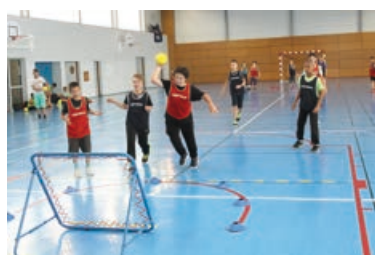
Une des nombreuses animations proposées aux jeunes de la MJA : le tchoukball - P.16