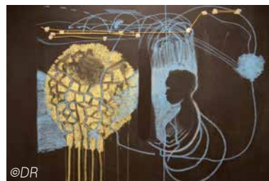
Minia Biabiany - Blue Spelling : A Change of Perspective is a Change of Temporality, 2017, photogramme.

"Damien & P. Nicolas" de Ludovic Chemarin© Jusqu'au 28 juin