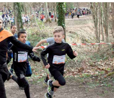
es de CE2, CM1 et CM2 des groupes scolaires de l'école de Paucourt et de l'école Pasteur de Amilly au Domaine