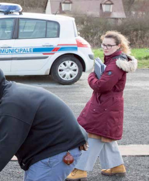
La Police municipale a prêté sa voiture pour les besoins du tournage.

participe depuis trois ans au concours de tournage de leur court-métrage "On